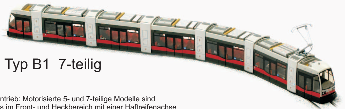
Typ B1 7-teilig

Der Antrieb: Motorisierte 5- und 7-teilige Modelle sind jeweils im Front- und Heckbereich mit einer Haftreifenachse angetrieben. Stromabnahme erfolgt über acht Räder. Die vier Räder mit Haftreifen bringen eine sehr hohe Schubkraft auf die Schiene. Für ausreichenden Ballast ist ebenfalls gesorgt.