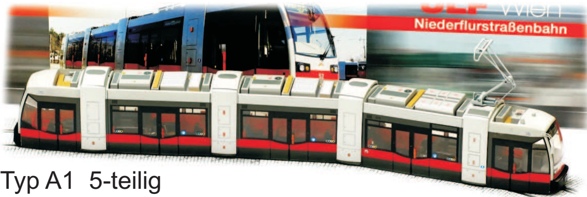
Typ A1 5-teilig