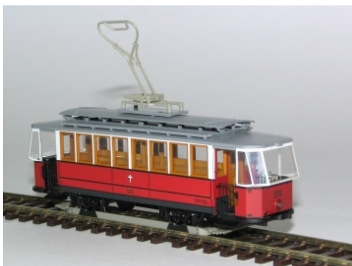
Ab sofort erhältlich Best Nr.:1001030-C Nr.574 rot/weiß