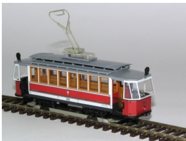
Ab Dez. 2006 erhältlich Best Nr.:1001030-B Nr.765 rot